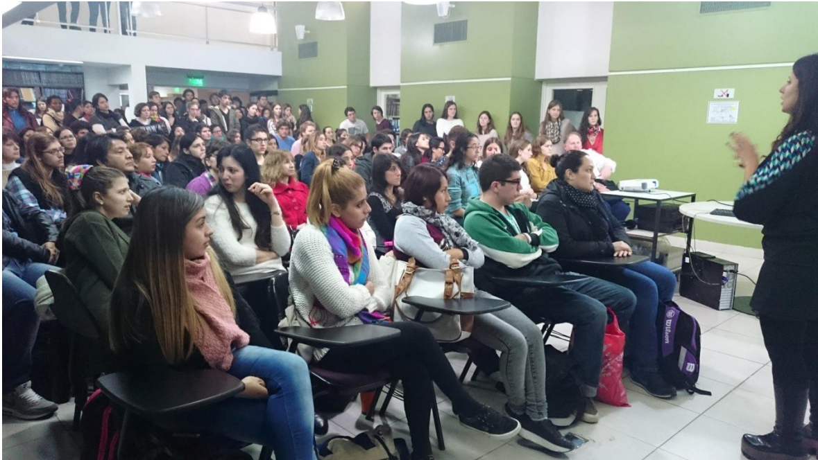
Exposición durante la I Jornada de Seguridad en la atención del Paciente para alumnos