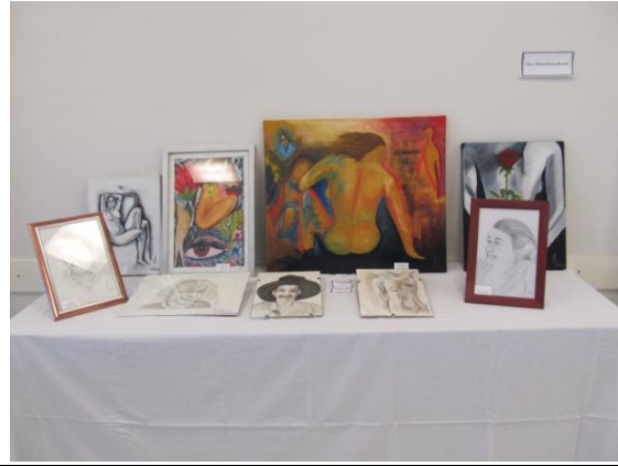
Algunas de las obras de arte expuestas