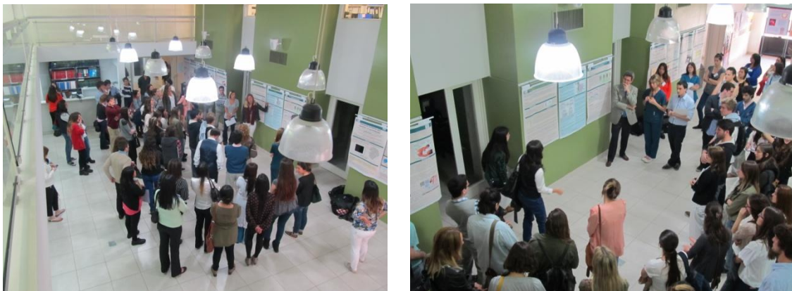
Alumnos presentando sus trabajos, ante los respectivos Jurados

En las siguientes imágenes pueden apreciarse distintas actividades desarrolladas durante las Jornadas