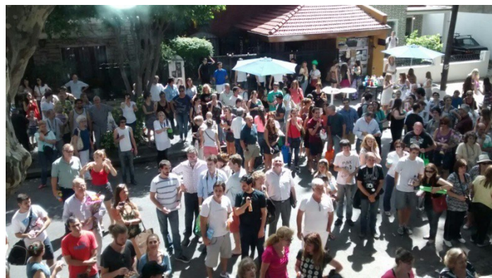
Familiares y amigos aguardando a los alumnos en la entrada de la institución