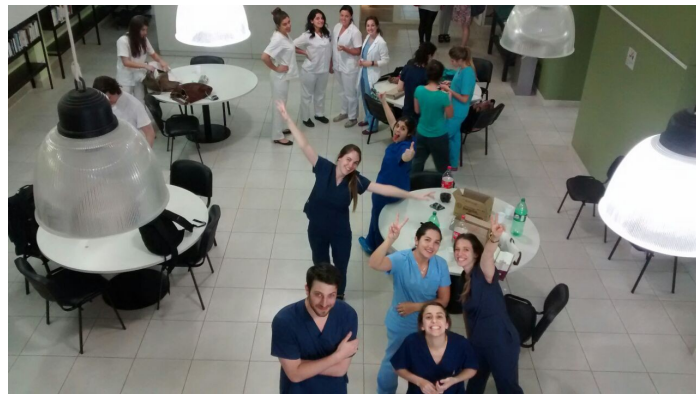
Alumnos en la sala de lectura de la biblioteca al finalizar el examen, esperando el resultado del mismo

Egresaron 30 alumnos del IUC a los cuales felicitamos por finalizar esta etapa y fundamentalmente por el esfuerzo, constancia y dedicación de estos años. Éxitos en su profesión!